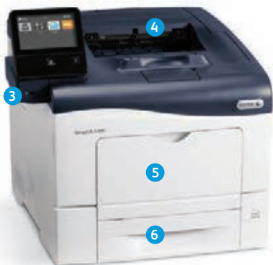
Barevná tiskárna Xerox® VersaLink® C400 Tisk.

2 Porty USB lze zakázat; 3 jen model VersaLink C405.