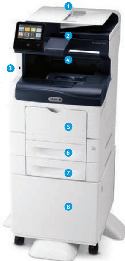
Barevná multifunkční tiskárna Xerox® VersaLink® C405 Tisk, kopírování, skenování, faxování a podpora e-mailů.